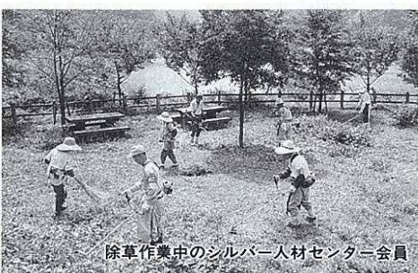
除草作業中のシルバー人材センター会員

民生局長 センターの事業は、今後の生きがい対策の重要な柱としてとらえており、機能の充実を図るうえで急務の課題である、会員の技能習得や作業等を行う作業場の確保に努めていきたいと考えています。