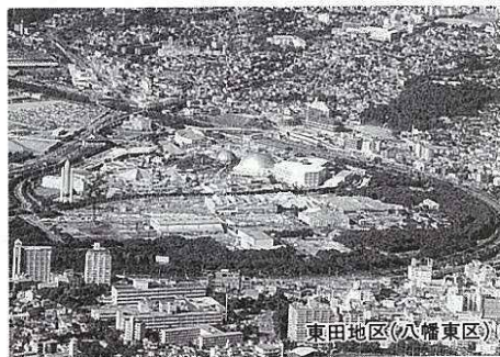
東田地区(八幡東区)

建設局長 中央町商店街の振興策のうち、電線類の地中化事業は、中央町交差点からレインボープラザ側については近々工事の予定です。中央町商店街側は、老朽化した水道管、下水道管の敷設替え、