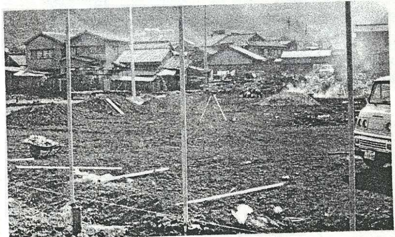
着工された新幹線富野立坑