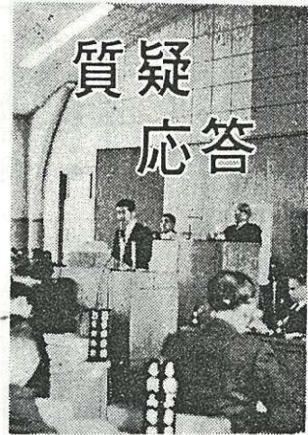
三月二、三日の二日間、議案に対する質疑や市政全般についての質問が本会議で行なわれました。以下、市民生活に關係の深いものを取り上げました。