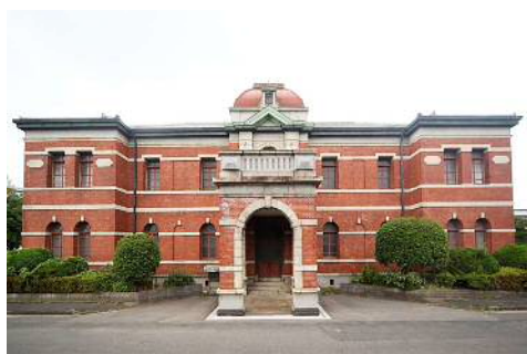
官営八幡製鐵所 旧本事務所(非公開)