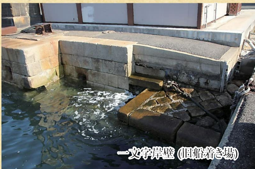
一文字岸壁(旧船着き場)