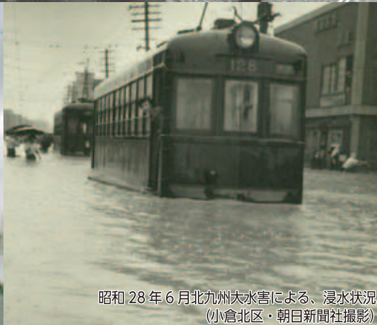
昭和 28 年 6 月北九州大水害による、浸水状況 (小倉北区)