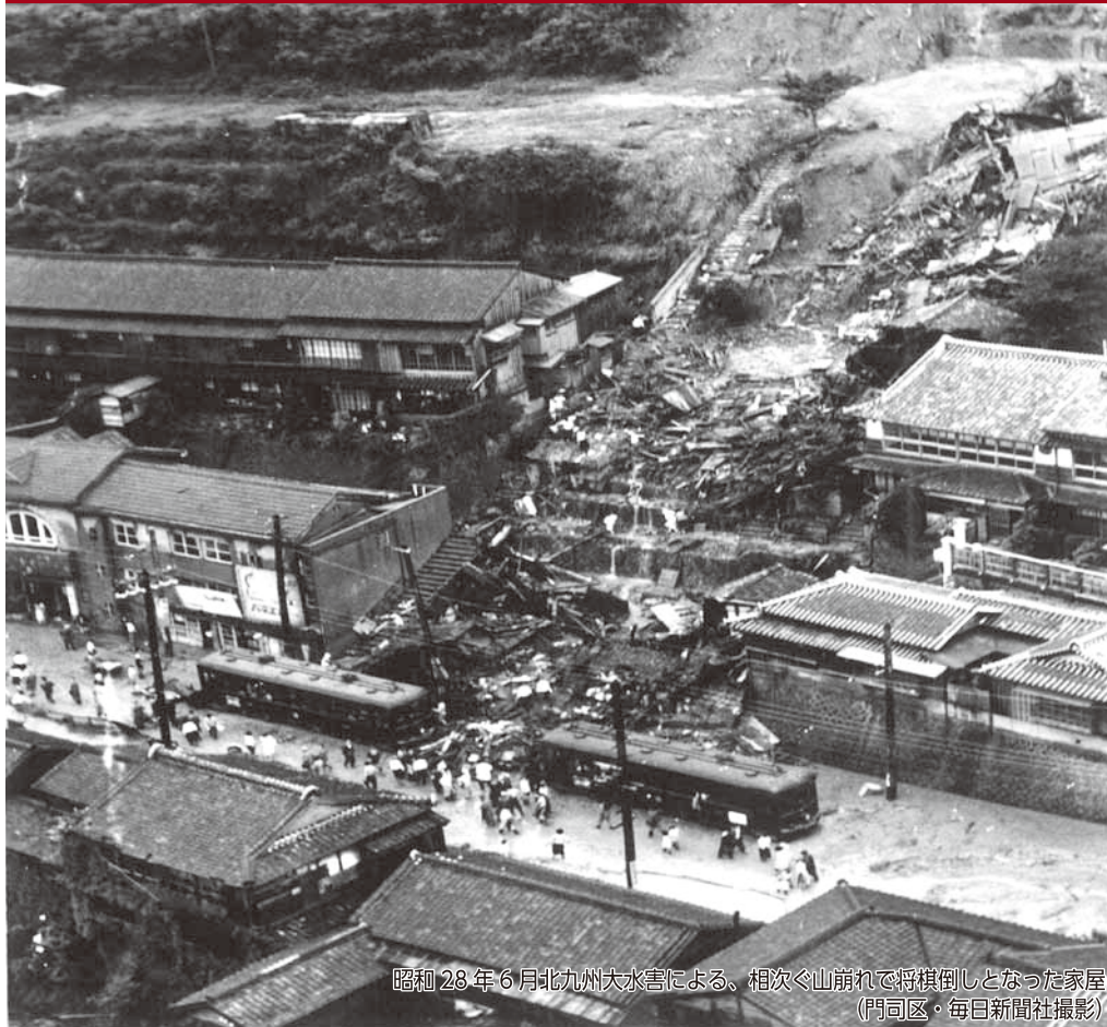
昭和 28 年 6 月北九州大水害による、相次々山崩れで将棋倒しとなった家屋 (門司区)