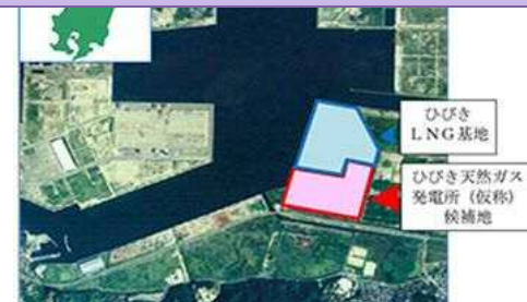
響灘火力発電所（仮称） ※事業化検討中