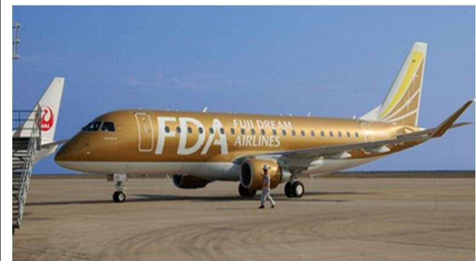
北九州⇄名古屋小牧線就航