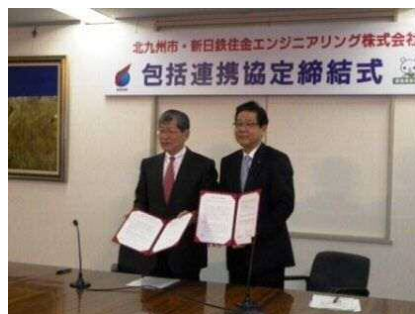
包括連携協定締結式