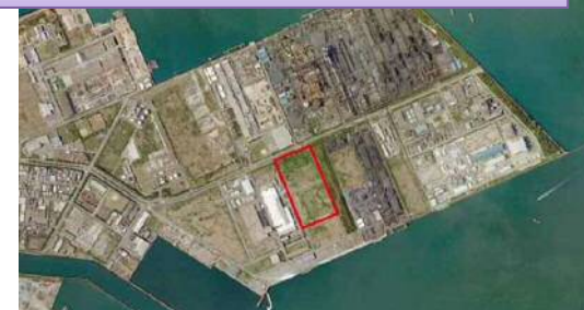
環境省「風力発電等に係る地域主導型の戦略的適地抽出手法の構築事業」