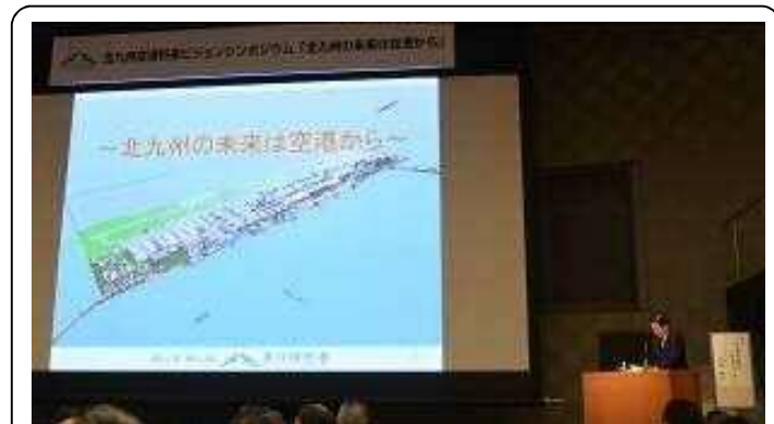
北九州空港将来ビジョンシンポジウム