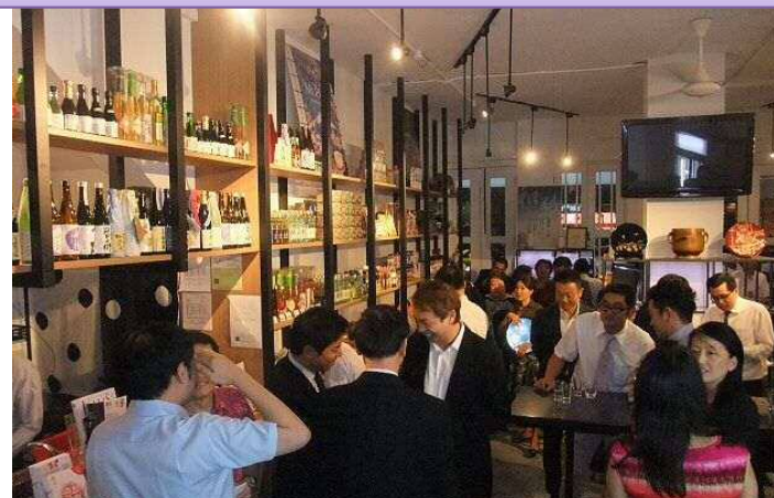
香港アンテナショップ