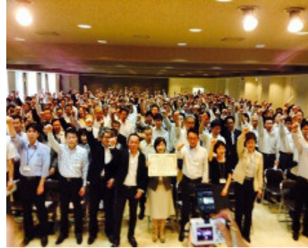
北九州市イクボス宣言（H26年12月26日）