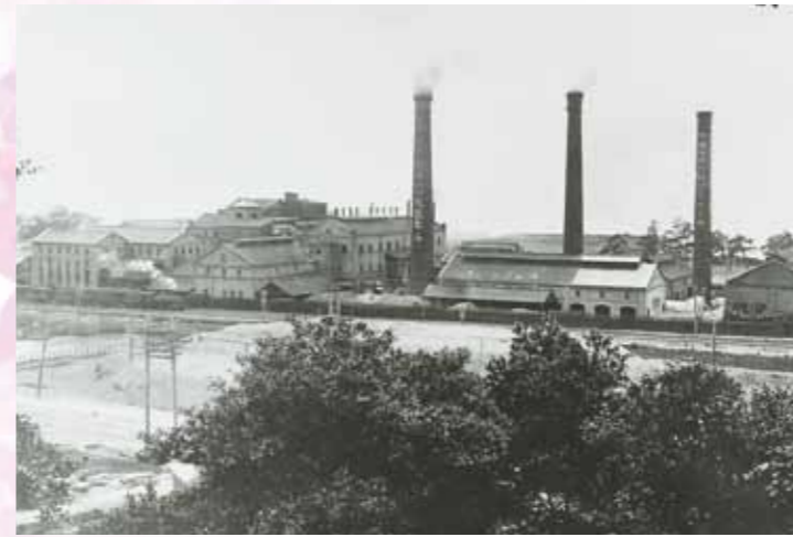
大日本製糖(株)大里工場全景(大正8年)