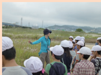
環境体験科の取り組み