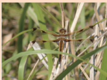
響灘ビオトープのベッコウトンボ

環境保全対策等に活用するため、生き物調査を行うなど、自然環境に関わる情報を収集し、その把握に努めます。