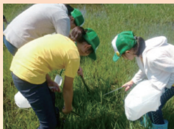
こどもエコクラブ

環境学習などにより、自然環境に対する広い視野をもって行動できる人づくりに取り組みます。