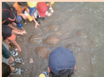
カプトガニ産卵観察

自然とのふれあいを通じて、生物多様性によってもたらされる恩恵の重要性への理解を広めていきます。