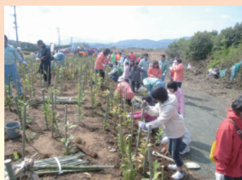
鳥がさえずる緑の回廊の植樹