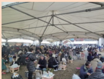
豊前海一粒かきのかき焼き祭り