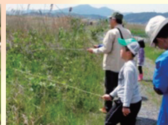
ベッコウトンボ頭数調査