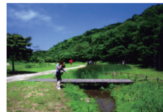
公園散策(山田緑地)