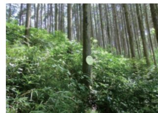
荒廃森林の再生(整備後)(小倉南区)