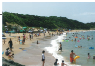
海水浴(脇田海水浴場)

「文化的サービス」とは、例えば魚釣りや海水浴、登山や公園散策、紅葉狩りなど、生態系から得られる精神的な充足や、豊かな感性や美意識の醸成、レクリエーションの機会が提供されることをいいます。