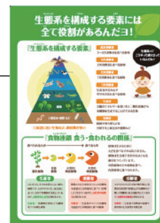
食物連鎖を示したパネル(響灘ビオトープで使用)

「基盤サービス」とは、例えば動植物の死骸をバクテリアが分解し豊かな土壌が形成され食物連鎖を支えていることなど、生態系から人間を含むすべての生命の生存基盤である環境が提供されることをいいます。