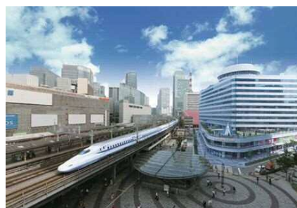
東京交通会館ビル 外観イメージ

首都圏におけるU・Iターン推進や企業誘致等の機能強化を図るとともに、専門相談員による「移住・就職相談窓口」を設置するなど、本市への移住・定住促進に向けた取組みを推進するため、首都圏本部（東京事務所）を交通利便性の高い東京交通会館ビル（JR有楽町駅前）に移転します。