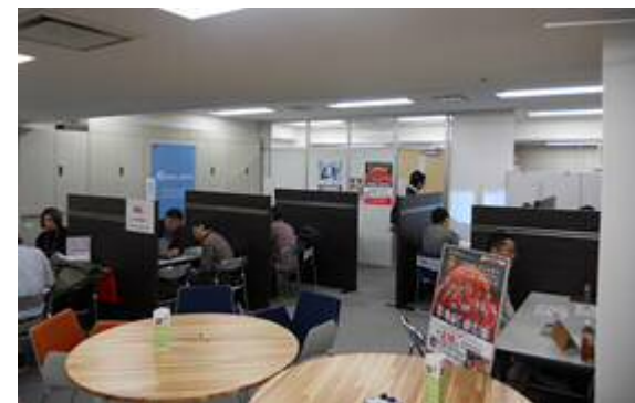
北九州市 企業立地2days スペシャルプログラム (東京)