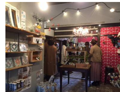
リノベーションスクール@北九州