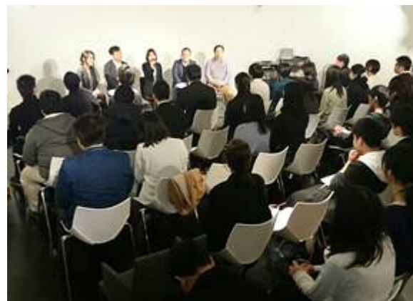
Kitakyushu IT JAM (北九州)