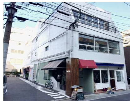
室町シュトラッセ (小倉北区)