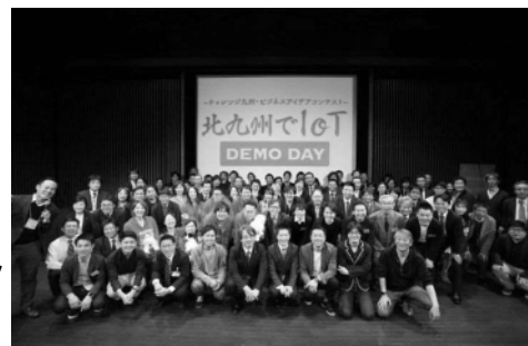
北九州でIoT成果発表会の様子