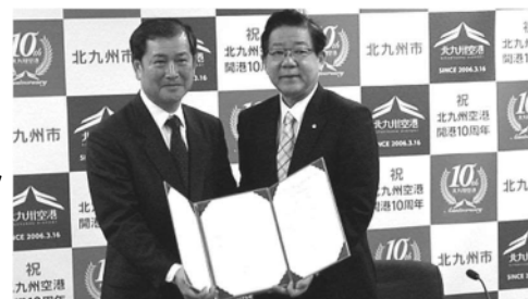
連携協定調印式の様子