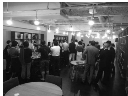
北九州スタートアップネットワークの会の交流会の様子 (会場：fabbit)