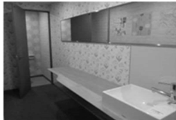
トイレとパウダールーム