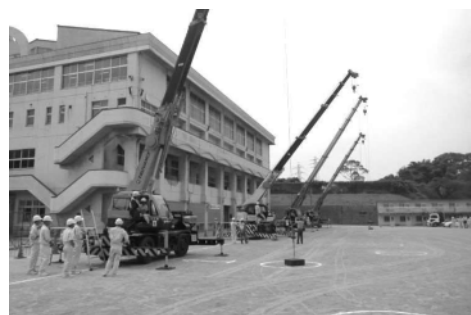
高校生クレーン体験学習