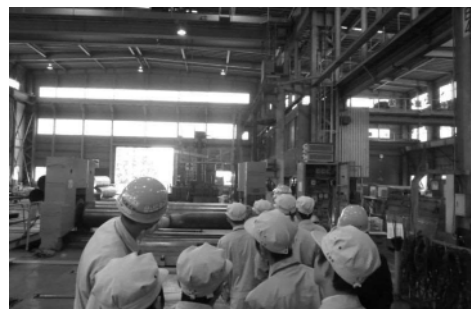
工業高校生を対象とした工業団地内オープンファクトリー