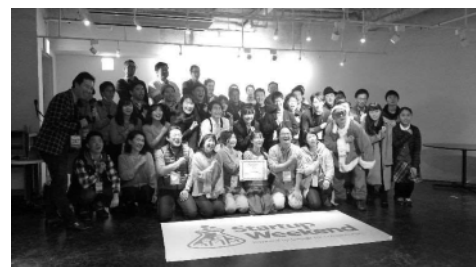
スタートアップウィークエンドの様子 (会場：fabbit)