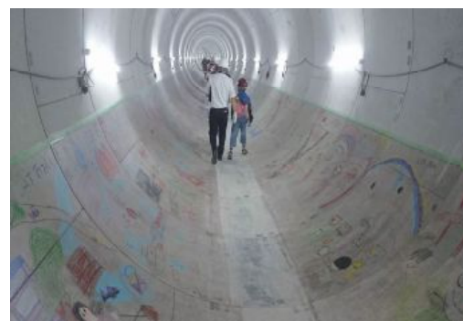
タイムトンネル事業