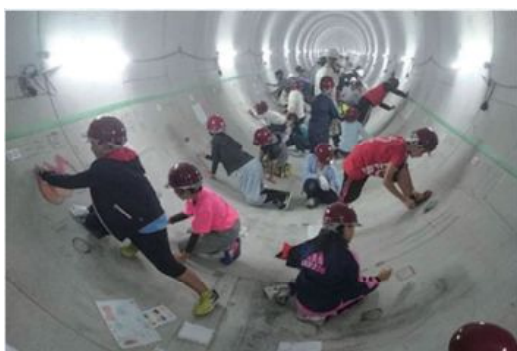
タイムトンネル事業