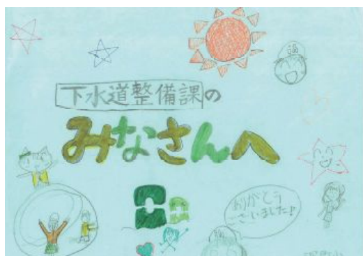
子どもたちからの手紙