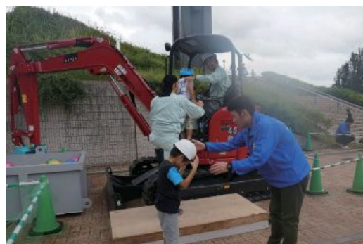
バックホウ乗車体験