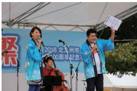
ステージイベント