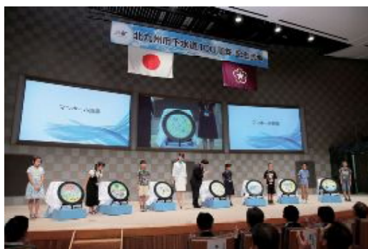
ポスターコンテスト表彰