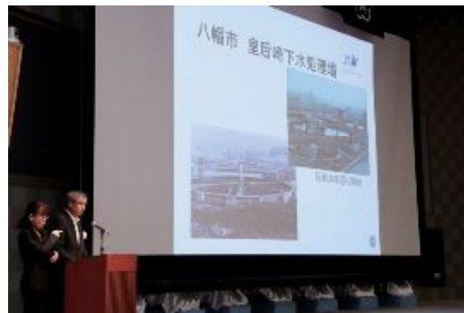
100周年のあゆみ紹介