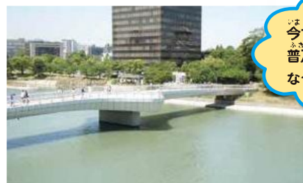
水質が改善され豚川(現在)

下水道が整備されたことによって、次第に川や海は綺麗になってきました。今では、綺麗な水にしか棲めないホタルやアユなどが、紫川などに戻ってきました。