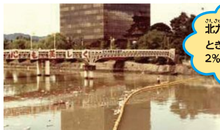
「どぶ川」と言われていた紫川(1970年代)

みなさんにとって当たり前にある下水道ですが、下水道が無かった頃は、川や海はお魚たちが棲めないくらい汚れてました。