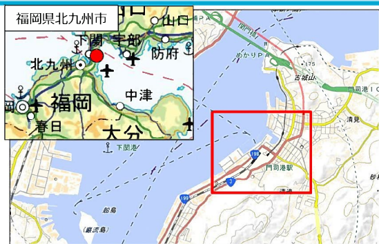
国土地理院地図（電子国土Web）( http://maps.gsi.go.jp )をもとに国土交通省作成