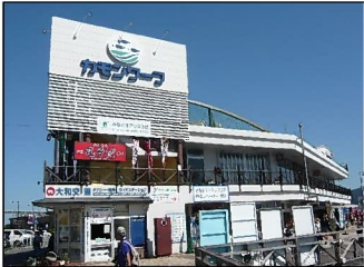
構成施設のイメージ