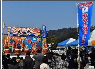
地域振興イベントの開催状況