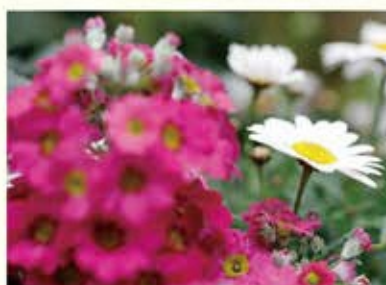
奥の花にピントを合わせると、手前の花がぼけて奥の花がくっきり見えます。