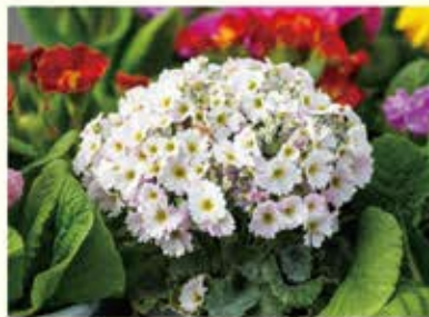
光が左側からさすように位置を変更、明暗が出て立体的な写真になりました。

被写体の中での主役の花を決めましょう。主役の花を決めたら、主役の花にカメラの機能を使ってピントを合わせましょう。