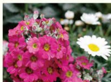
手前の花にピントを合わせると、奥の花がぼけて手前の花がくっきりと見えます。

右記の2つはほんの一例です。綺麗な花を撮影するために大切なことは、花を漠然と撮影するのではなく、花を引き立たせるための工夫と構図を決めるための試行錯誤が大切だと思います。