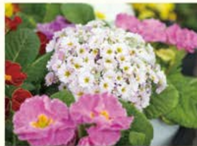
真正面からの光では全体に光が当たってしまっ平面的な写真になります。