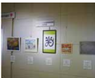
絵画、書道、写真などの、個性豊かで創造的なアート作品