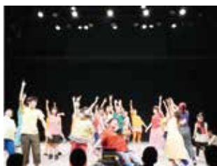
障害の有無を超え、様々なコラボレーションで生まれる新たな表現