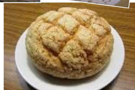
クッキー生地メロンパン