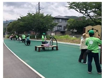
遊具の状況（朽網中央公園）