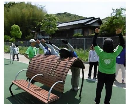
遊具の状況（長野緑地）