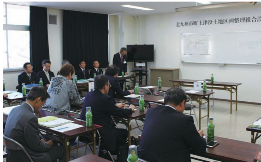
設立総会(平成29年11月27日)

施 行 者 北九州市町上津役土地区画整理組合 施行面積 1.96ha 施行期間 平成29年度～令和2年度 総事業費 488百万円 減 歩 率 51.5%(公共5.5%、保留地46.0%)