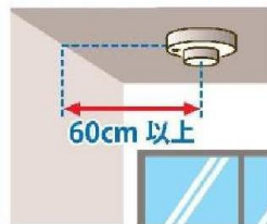
天井に取り付ける場合