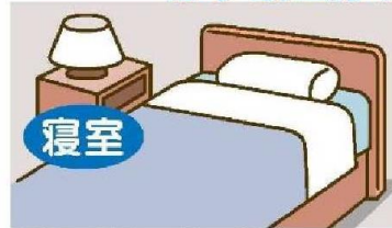
普段の就寝に使う部屋