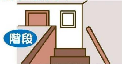
寝室がある階の階段最上部