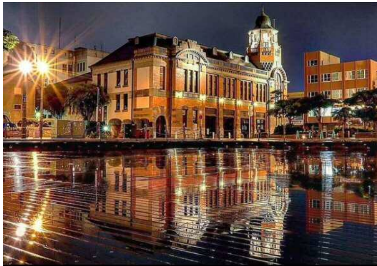
【グランプリ】 門司港レトロ