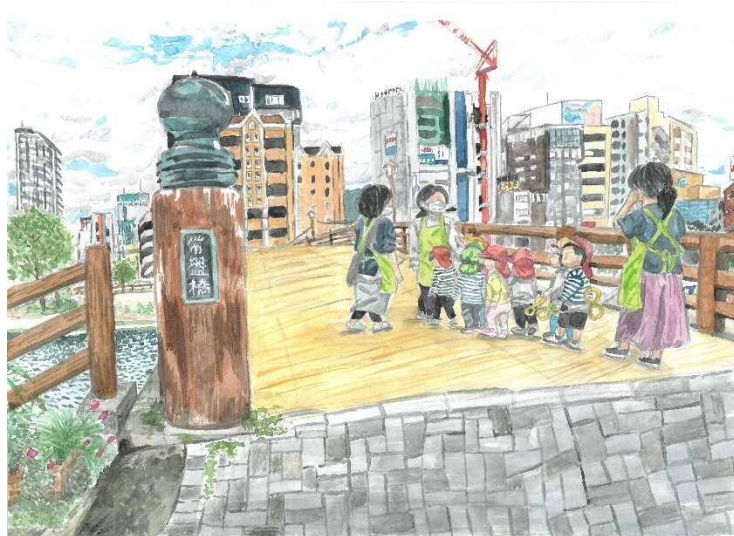
【準グランプリ】 お散歩