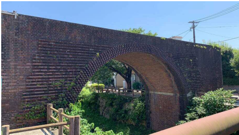
【準グランプリ】 茶屋町橋梁の存在感