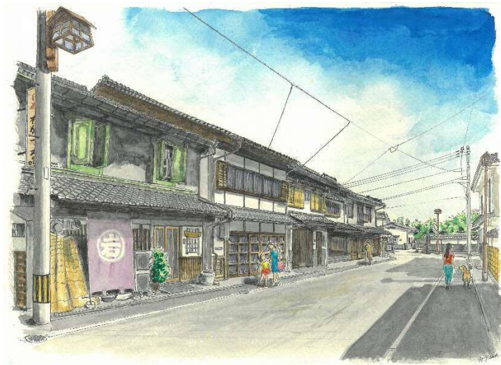
【グランプリ】 木屋瀬の町並み