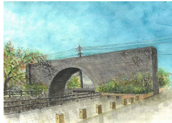
【佳作】 史跡九州鉄道茶屋橋橋梁