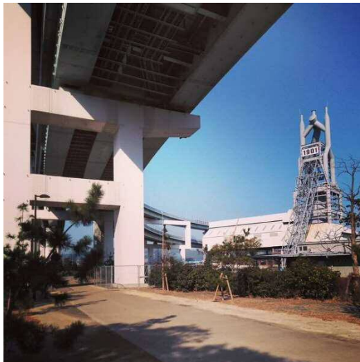
【準グランプリ】 東田松並木