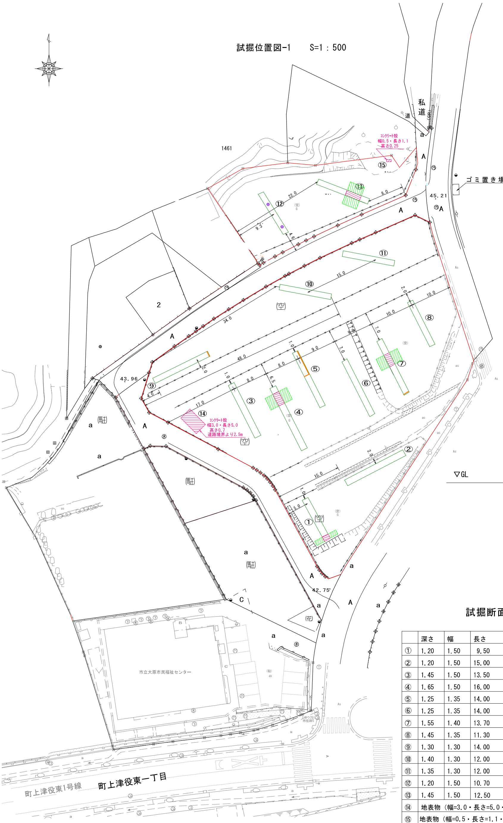
試掘位置図-1 S=1 : 500