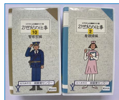
〈職業紹介ビデオの一部〉

多くの中学校では生徒が興味をもった業種の職場に出向いて仕事を体験する職場体験を行っています。生徒はこの体験を通して、望ましい勤労観や職業観を学んだり、自らの将来に希望を抱き、その実現を目指す意欲をもったりします。この職業体験は進路の岐路に立ち始めた中学生にとって貴重な学習です。しかし、昨年度はコロナ禍で例年のように、仕事場に出向いたり多くの人と接したりすることができませんでした。そこで、指導する先生方は本センターにある15巻の職業紹介ビデオを活用し、ポスターセッション形式で視聴しました。教材を視聴した生徒から次のような感想をいただきました。