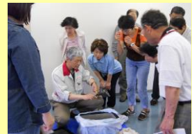
④今後の使用方法 の説明