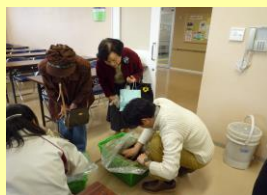
①コンポストの 状態確認