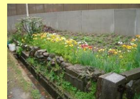
③花壇などでの使用 方法の説明