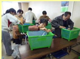
②コンポスト化容器 の作製