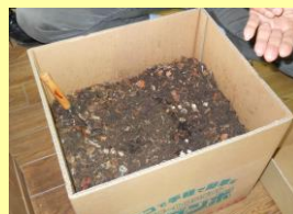
②堆肥づくりの 説明