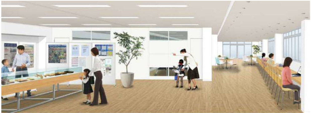
【折尾まちづくり記念館内観イメージ（間仕切り有）】