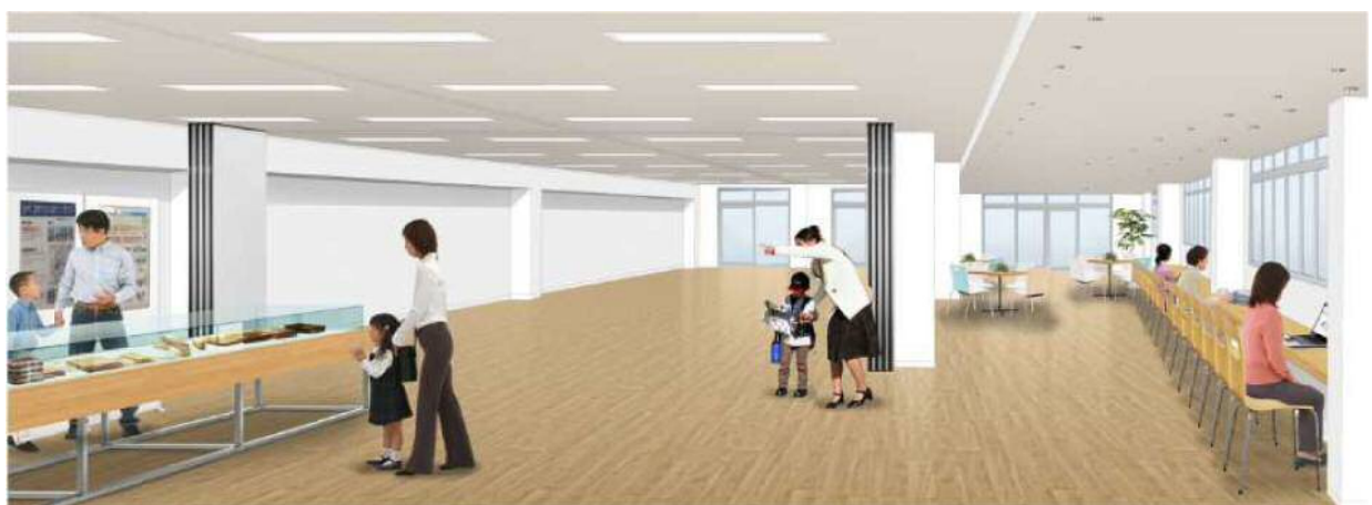
【折尾まちづくり記念館内観イメージ（間仕切り無）】