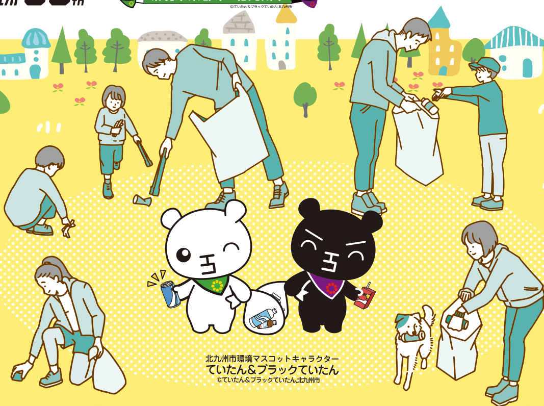
北九州市環境マスコットキャラクター ていたん&ブラックていたん ©ていたん&ブラックていたん北九州市