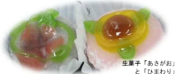
生菓子「あさがお」と「ひまわり」

戸畑の地で80年以上営業している老舗和菓子屋さんです。入るとすぐにショーケースに並んだ涼しげな生菓子に目を奪われます。