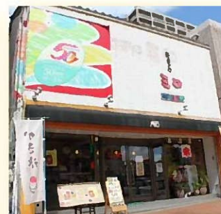
創業50年を機にリニューアル