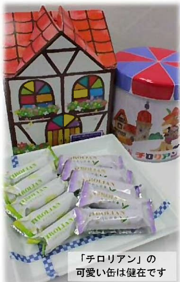
「チロリアン」の可愛い缶は健在です