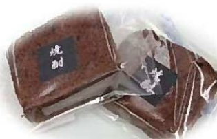
焼酎ケーキ(1個200円)は男性にも人気です