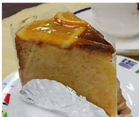
オレンジケーキ (250円)