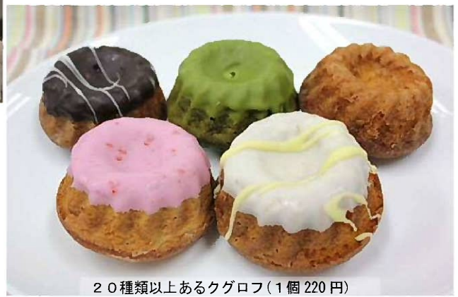
20種類以上あるクグロフ(1個220円)

フランス語で「愛しい人、最愛の人」という意味を持つ店名「マシェリ」。大切な人においしく食べて欲しい気持ちの込められたケーキやパイシューなどがショーケースに彩り豊かに並んでいます。なかでも目を引くのは看板商品“クグロフ”。なんと20種類以上もあるんですよ。見た目だけでなく、しっとりふわふわの生地で、一口食べると、鼻から抜ける香りがたまらない逸品です。