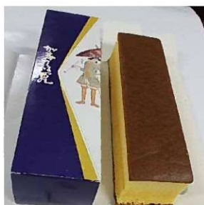
カステラ (0.75斤 1300円)