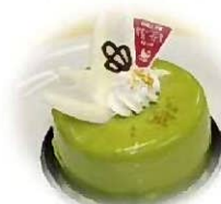
新商品 「ビスターチオ」 (520円)