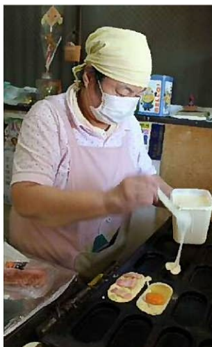
7種類ある具材の中で、一番人気はベーコンエッグ一つ一つがボリュームあり