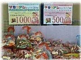
「チロリアン」のお得なセット (1260円→1000円)