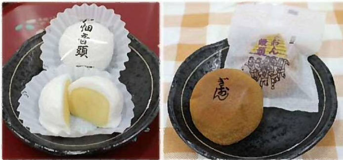
銘菓「戸畑音頭」(1個130円)