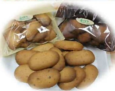
手づくりクッキー

手づくりクッキー、焼き菓子などもあります。シンプルなりボンのラッピングは手土産にもぴったりです！ぜひ、一度のぞいてみてくださいね。