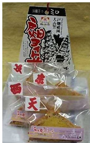
戸畑ヨイトサは4山揃って一袋1000円