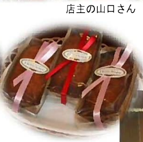
ブランデーケーキ