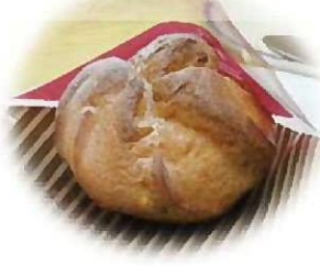
シュークリーム(1個 220円)