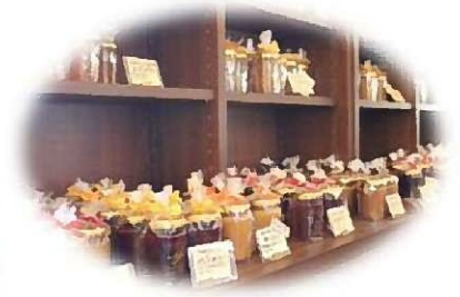
季節感たよう手づくりジャム