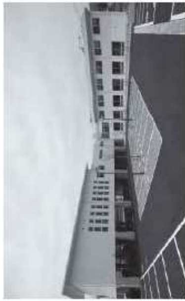
若松区役所島郷出張所