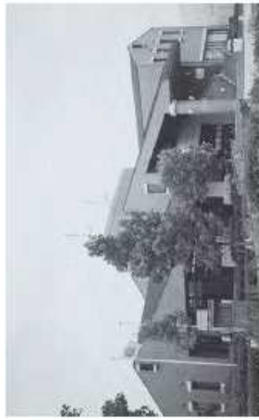
八幡西区役所八幡南出張所