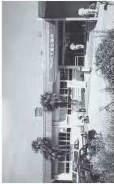
門司区役所大里出張所