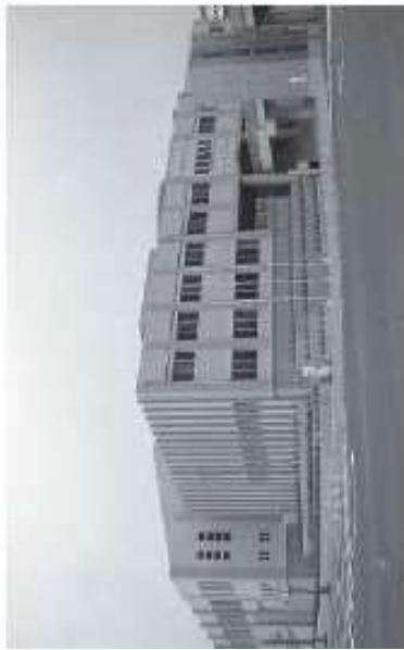
門司区役所松ヶ江出張所