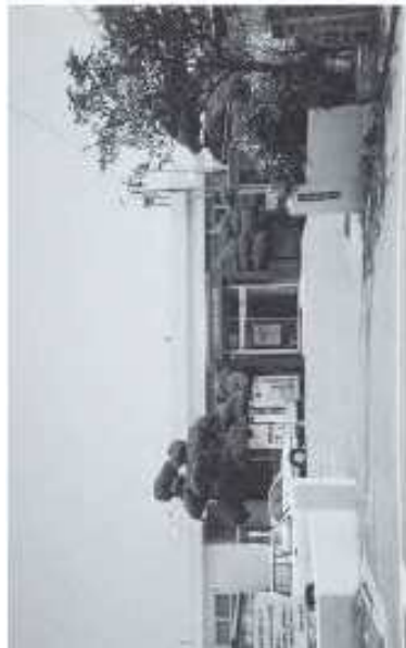
小倉南区役所両谷出張所