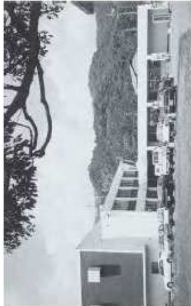
小倉南区役所東谷出張所