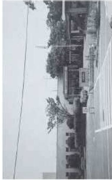
八幡西区役所上津役出張所