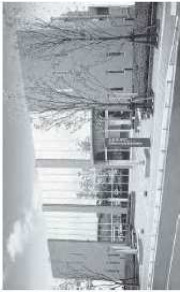
小倉南区役所曾根出張所