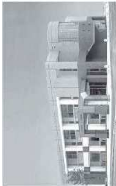
八幡西区役所折尾出張所