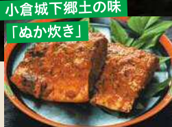
小倉城下郷土の味 「めか炊き」