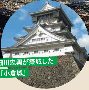
細川忠興が築城した 「小倉城」

一泊(おひとり) 1,000円 (税込1,100円) 〜 3,000円 (税込3,300円)