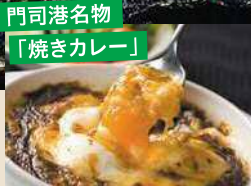
門司港名物 「焼きカレー」