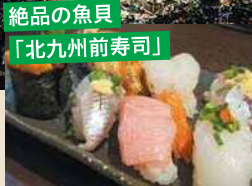
絶品の魚貝 「北九州前寿司」