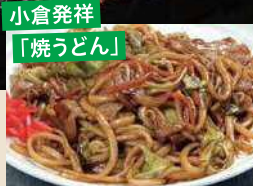
小倉発祥 「焼うどん」