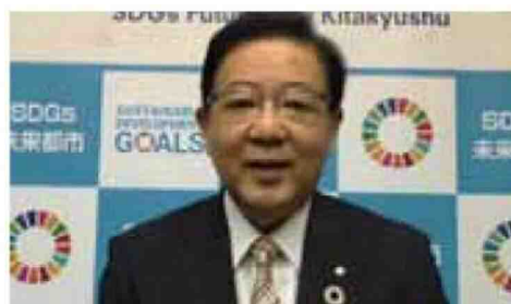
第4回ラウンドテーブル会議（オンライン）でのビデオメッセージ