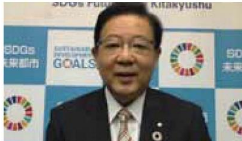
第4回ラウンドテーブル会議（オンライン）でのビデオメッセージ