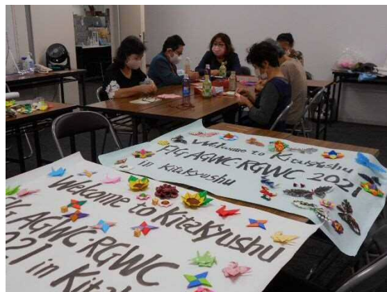
折り鶴、応援メッセージ作成の様子