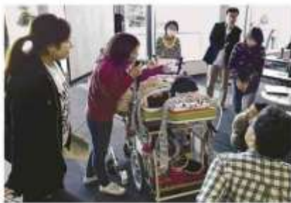
久米市介護福祉サービス事業者協議会が開いた地域支援のあり方を考える研修会。医療的ケアが必要な当事者らから協議し、多職種の支援者ら約100人が参加した。＝2017年