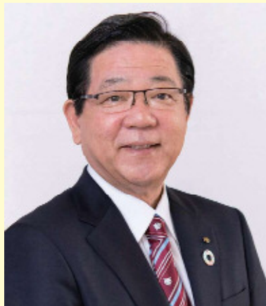
北九州市長 北橋 健治