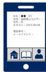
③電話番号、メールアドレス等の情報を利用者が入力して登録 (氏名、住所、生年月日、性別はマイナンバーカードから自動入力)