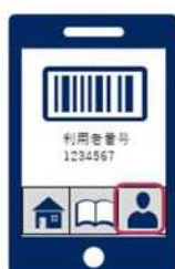
⑤図書館アプリを利用開始

(※) パスワードはマイナンバーカードを自治体窓口で受け取る時にご自身で設定された6～16桁の英数字です