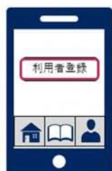
①図書館アプリで「利用者登録」を選択