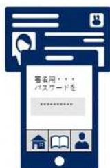
②マイナンバーカードをスマートフォンにかざし、6～16桁のパスワード(※)を入力 署名用電子証明書にて本人確認