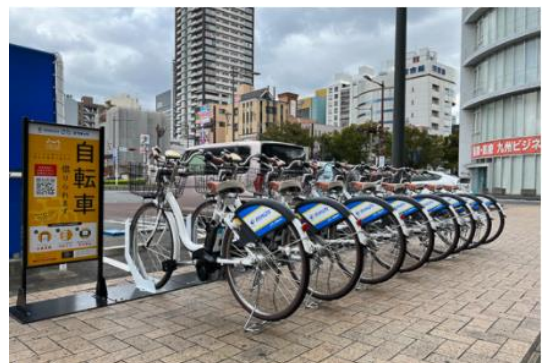
シェアサイクル事業(事業開始、R3~)