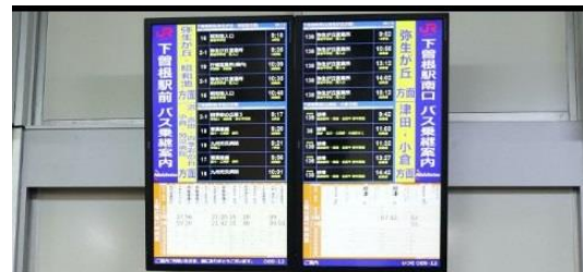
JR改札口にバスの時刻表を表示