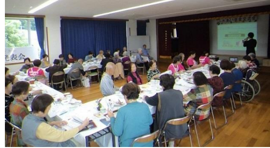
高齢者モビリティマネジメント(H29～R2) 計52箇所(約2,200人)