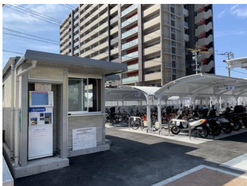
JR 八幡駅(H31 完成)