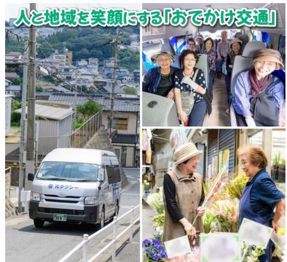
市政だより掲載写真(R1)