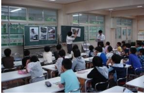
学校モビリティマネジメント(H28～R2) 計15校(約600人)