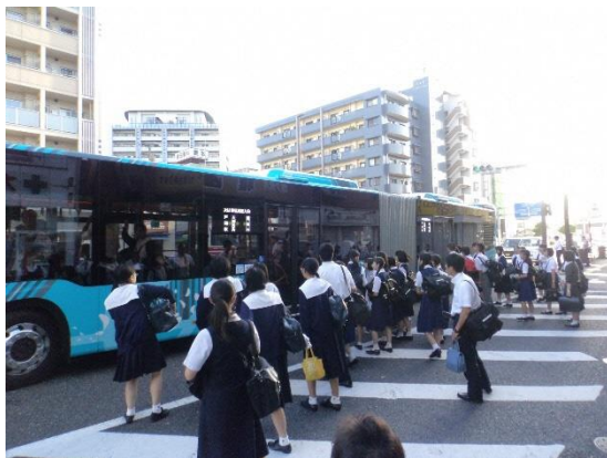
小倉～戸畑線(南小倉駅前バス停)