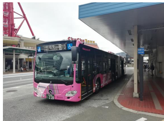
小倉～恒見線(砂津バス停)