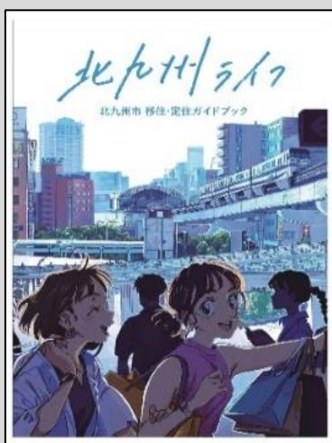
移住・定住ガイドブック

・若い世代に人気があるインスタグラムを活用し、市内の大学生と連携して若者目線で情報を発信。