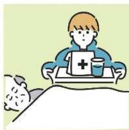
がん・難病・精神疾患など慢性的な病気の家族の看病をしている。