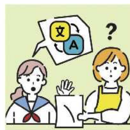
日本語が第一言語でない家族や障がいのある家族のために通訳をしている。