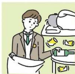
アルコール・薬物・ギャンブル問題を抱える家族に対応している。