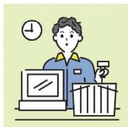
家計を支えるために労働をして、障がいや病気のある家族を助けている。