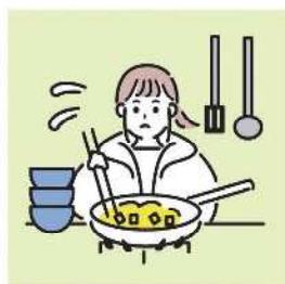
障がいや病気のある家族に代わり、買い物・料理・掃除・洗濯などの家事をしている。

家族にケアを要する人がいる場合に、大人が担うようなケア責任を引き受け、 家事や家族の世話、介護、感情面のサポートなどを行っている18歳未満の子どもをいいます。