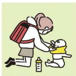
家族に代わり、幼いきょうだいの世話をしている。