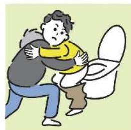
障がいや病気のある家族の入浴やトイレの介助をしている。