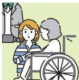
障がいや病気のあるきょうだいの世話や見守りをしている。