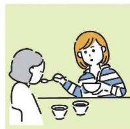
障がいや病気のある家族の身の回りの世話をしている。