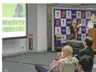
【公開講座イメージ】