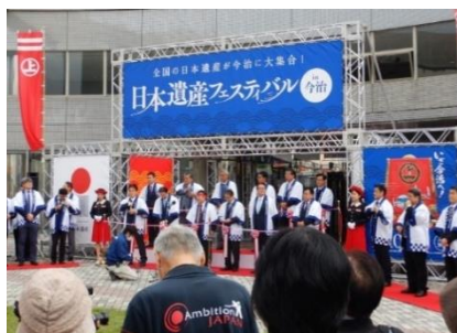
【日本遺産フェスティバル in 今治開会式】