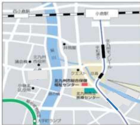
北九州市立総合保健福祉センター 「アシスト21」5階