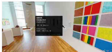
北九州市立美術館本館