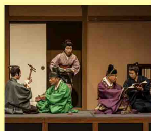
朝鮮通信使～雨森芳洲・誠信の交わり～