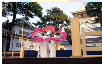
小倉城 新能2021 ベトナム民族舞踊