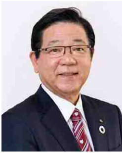
東アジア文化都市北九州 実行委員会 会長 北九州市長