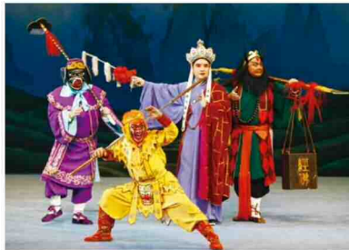
紹興市公演「孫悟空、三度白骨夫人と戦う」