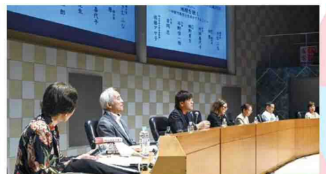
第三部 シンポジウム