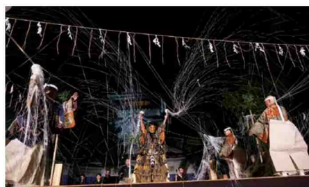
小倉城 新能2021「土蜘蛛」