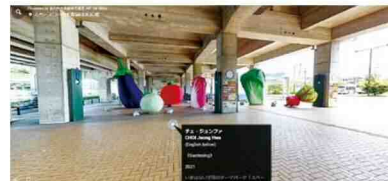
スペースワールド駅改札前広場