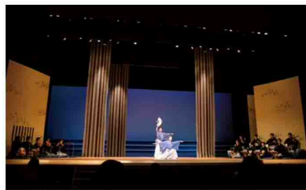
北九州市公演 新作日本舞踊「門司春秋」