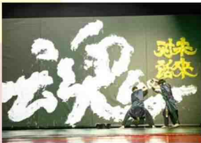
オープニング公演 書道パフォーマンス『未来永劫』

東アジア文化都市の成果の振り返りや今後の交流につなげる閉幕式典を開催しました。式典には多くの市民の皆様に参加いただき、オープニングでは書道パフォーマンス『未来永劫』を、フィナーレでは音楽と語りのステージ『秋冬-春夏』を披露しました。