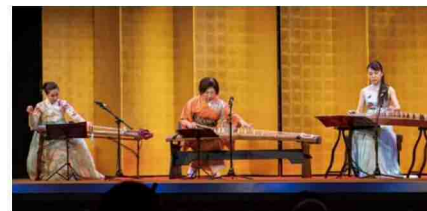
プロローグ饗宴「ともに」