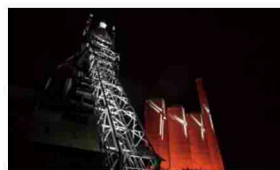
石井リーサ明理 《LIGHT X(ライト・クロス)》2021