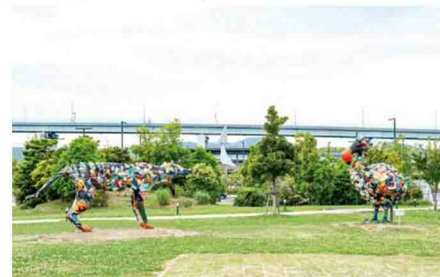
淀川テックニク《北九州のドードー/北九州のフクロオオカミ》2021 ※現在は、北九州市のいのちたび博物館敷地内に設置しています。