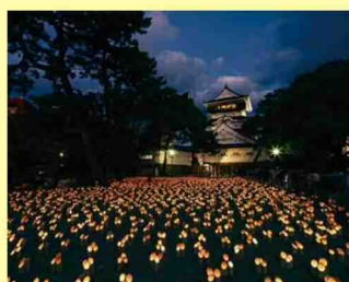
第3回小倉城竹あかり

市内全体で開催機運を盛り上げるため、市民の皆様が企画・実施する文化芸術の取組みやイベントを公募し、助成を行いました。