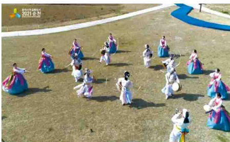
順천시公演「バンブッとキルノリ」