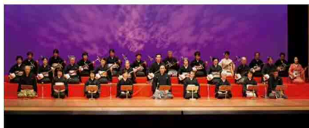
長唄演奏「元禄花見踊」