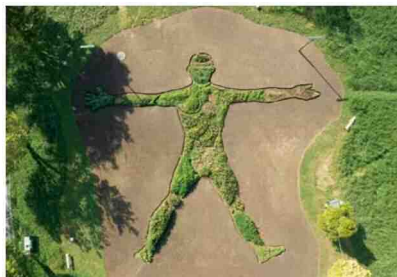
団塚栄喜《Medical Herberman Cafe Project》2021