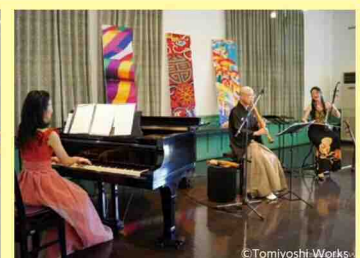
「花鳥風月」による東アジア文化体験講座