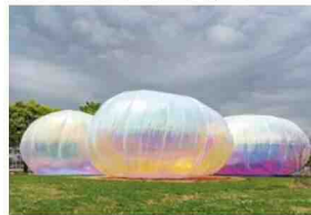
奥中華人《INTER-WORLD/SPHERE: The three bodies》2021