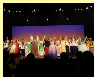
2021朝韓中日文化芸術公演「チャンチ」