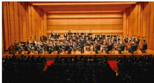
フレリー・ゲルギエフ指揮ウィーン・フィルハーモニー管弦楽団 2020年北九州公演

2020年11月5日、北九州ソレイユホールから日本公演がスタート。ウィーン・フィルとしても、コロナ禍、初の国外演奏会となりました。