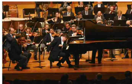
フレリー・ゲルギエフ指揮ウィーン・フィルハーモニー管弦楽団 デニス・マツーフ(ピアノ) 2020年北九州公演