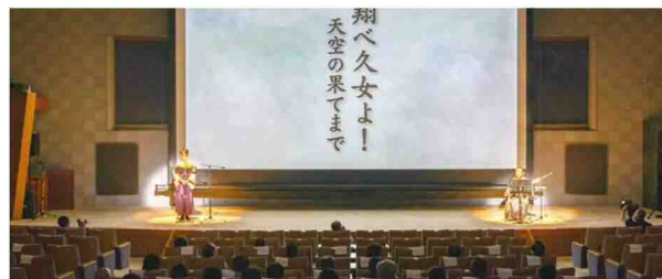
第二部 俳句朗詠劇