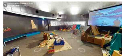
北九州市環境ミュージアム