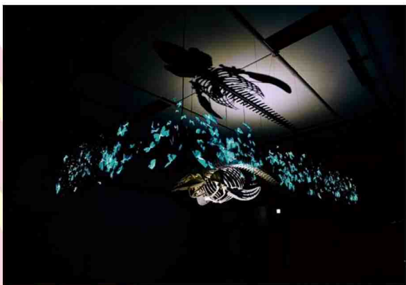
落合陽一《環世界の遠近法 -時間と空間、計算機自然と芸術-》2021