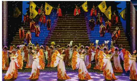
敦煌市公演「シルクロードの花吹雪」