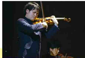
北九州市公演『秋冬-春夏』