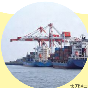
太刀浦コンテナターミナル