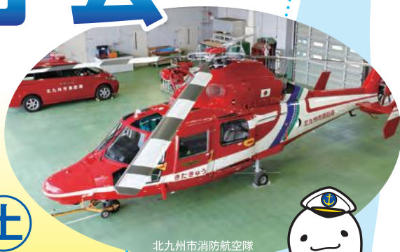
北九州市消防航空隊