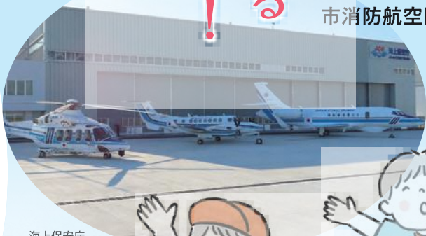
海上保安庁 北九州航空基地

いつもは門司港と唐戸港を結んでいる小型船舶「ふくまる」で、門司港から北九州空港までのクルージングを楽しんでみませんか。太刀浦コンテナターミナル、新門司フェリーターミナルや今年設置150周年を迎える部埼(へさき)灯台を海上から見学します。その後、北九州空港に上陸し、海上保安庁北九州航空基地及び北九州市消防航空隊で、海の安全や最新の救助現場などを見学します。