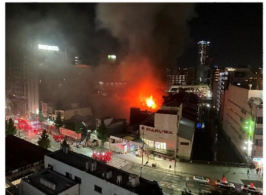
8月10日午後9時ごろ撮影