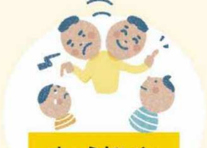
きょうだいと 比べてけなす