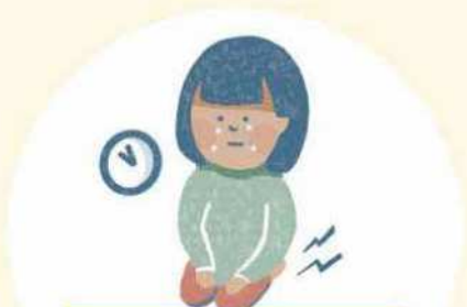
長時間の正座 ちゆう じ かん せい ざ