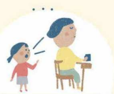
無視される む し

こんなことも、子どもの権利 こ けん り しん がい を侵害 おこな する行い おこな です。