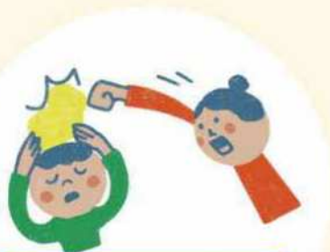
たたく・ける たたく・ける

これらはすべて「体罰 たい ばつ 」 おこな と ほう りつ きん し いって、法律で禁止されている行い おこな です。