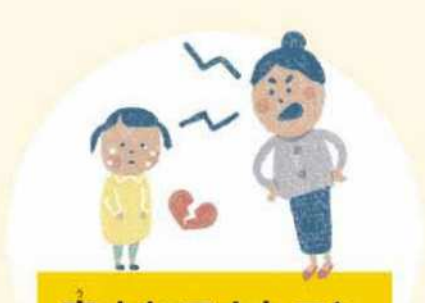
産まれてきたこと を否定される う ま れ て き た こ と

あなたには、これらの行い おこな から守られる権利 まも けん り があります。