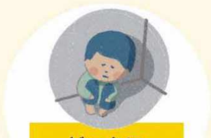
どこかに とじこめられる

こんなことも、子どもの権利 こ けん り しん がい を侵害 おこな する行い おこな です。