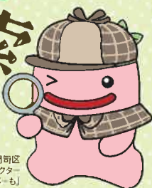
門司区 マスコットキャラクター 「じーも」