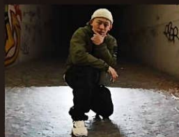
NOBUKID from Kitakyushu DANCE協会