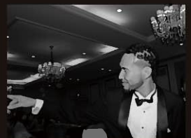
UMESSA from Kitakyushu DANCE協会