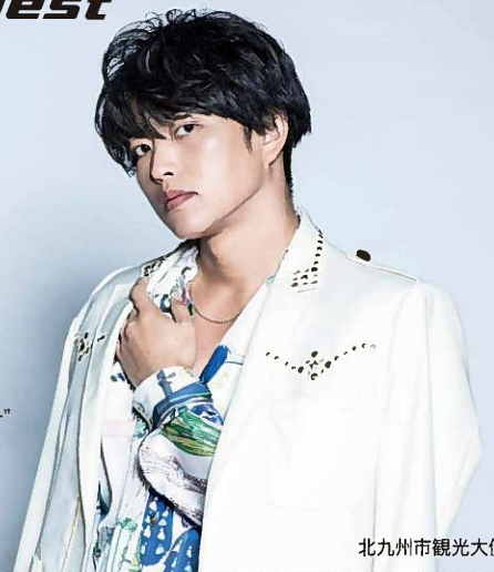
北九州市観光大使

国民的アーティスト DA PUMPのメンバーとして活躍。 世界の頂点を極めた男“キングオブダンサー” 前人未到8年連続ダンス世界大会優勝。 JAPAN DANCE AWARDにて、今最も 影響力があるダンサーに表彰されている。