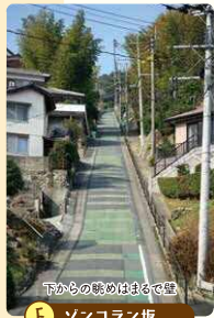
下からの眺めはまるで景 F ソンコラン坂

★距離300mほどで斜度20度超！ ★イタリアのロードレースの伝統的難所、 ゾンコラン峠に由来して名付けられました。