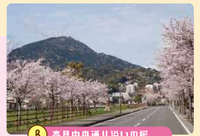
B 高見中央通り沿いの桜