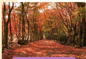
モミジトトンネル