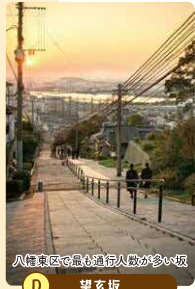
八幡東区で最も歩行人数が多い坂 D 望玄坂

★標高差約90m、水平距離は500m ★坂の上からは、刻々と表情を変える 見事な眺望が味わえます！