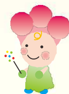
花新聞キャラクター ピッピちゃん