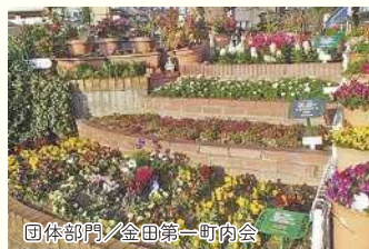
団体部門/金田第一町内会