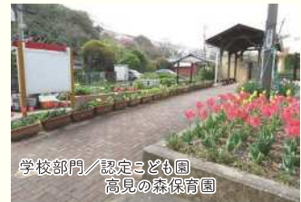
学校部門/認定こども園 高見の森保育園