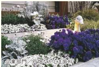
企業部門/戸畑ながしき歯科